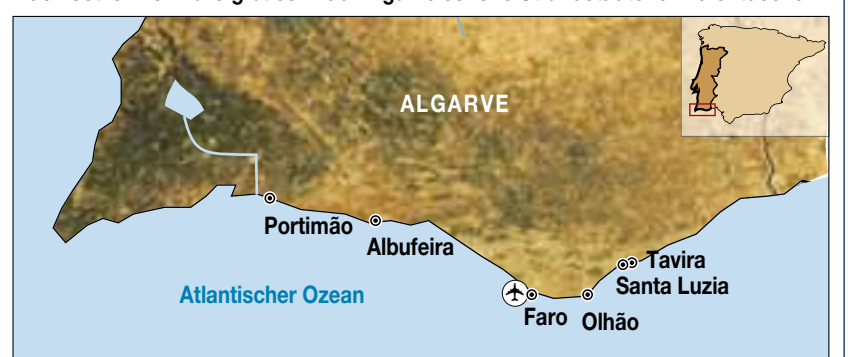
Grafik: DIE SÜDOSTSCHWEIZ

Auch östlich von Faro gibt es in der Algarve schöne Strandstädtchen zu entdecken.