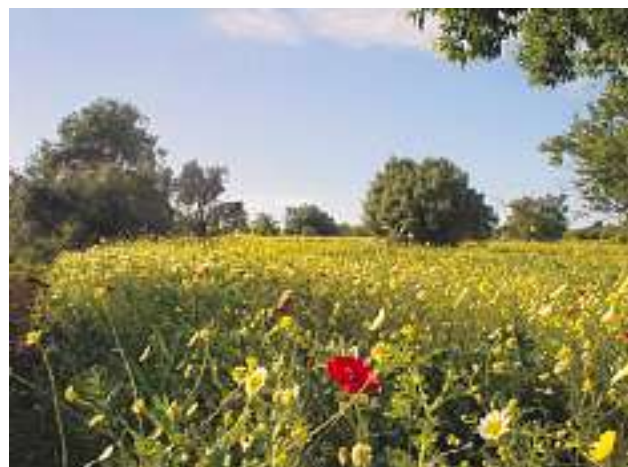
Sattes Grün und klares Blau: Ob zu Land oder zu Wasser – in der östlichen Algarve lockt die Natur.